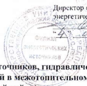
ГРАФИК планового профилактического ремонта теплонеточников, гидравлических и температурных испытаний тепловых сетей в межотопительном периоде 2015 года (Калининский район)